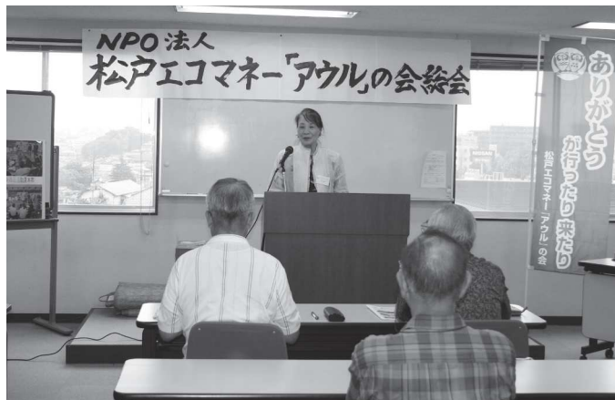
文入理事長の挨拶