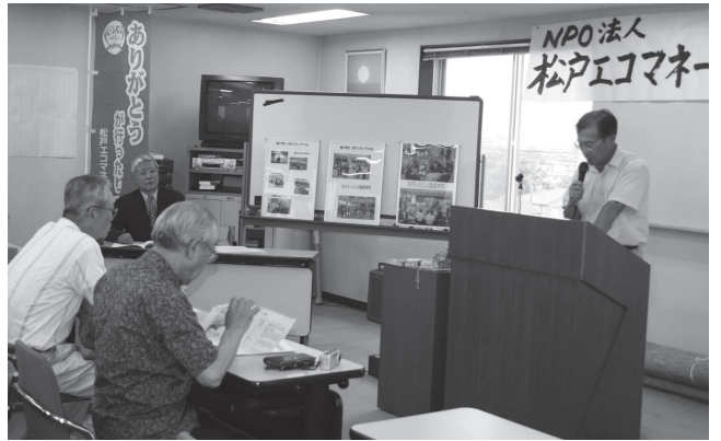
鳴海新理事による新年度活動計画の説明

また、総会終了後「ありがとう交流会」が開催され「医療講演会」「懇親会」などで会場も盛り上がりました。